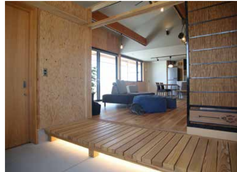
△玄関の広々とした土間とリビングの間仕切りには、以前のお住いの建具を再利用。解放すればリビングと一体的に利用することができます。