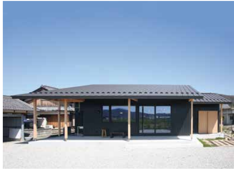
△焼き板が外壁前面に使用され、周囲の景観に調和するモダンな外観デザイン。良好な眺望が望める方角に深い庇と広い土間を計画。