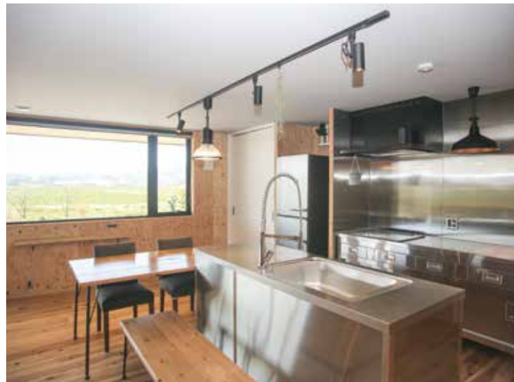
△キッチン、業務用キッチンを加工してIHコンロを埋め込んで利用しています。