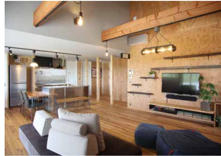
△屋根の勾配を生かした吹き抜けの大空間LDK。室内の壁仕上げには構造用合板を採用し、お施主様自身で棚などを自由に追加することができます。