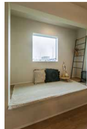
▲家族の気配を感じながら好きなことに集中できる居心地のいい空間