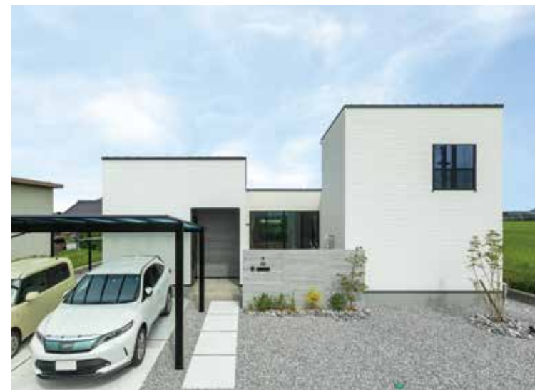
▲道路側は窓をなるべく少なくしながら、採光が取れるよう窓の配置を工夫