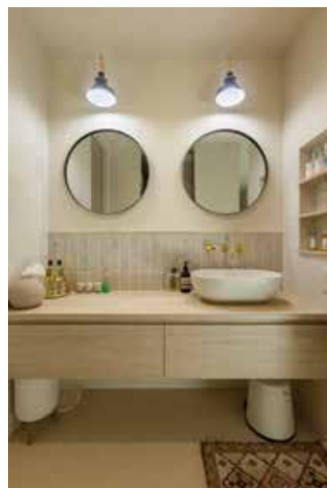
▲並んで身支度ができるゆとりのある洗面は、朝の忙しい時間もスムーズに