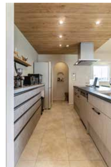
▲キッチンの奥にはちょっとした作業もできるミセスカウンター付きパントリー