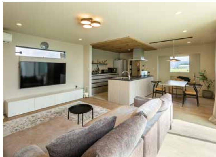
▲広々としたLDKは田園風景が見える窓を設けた、寛ぎの空間

「網戸ネット」「網戸フィルター」などの商品名で販売されているので、ご家庭の窓や玄関のタイプに合わせて探してみましょう。ただし砂ぼこりを防ぐ機能が優れている商品ほど、ネットやフィルターの目が細かいため、網戸の通気性は落ちてしまいますので注意しましょう。