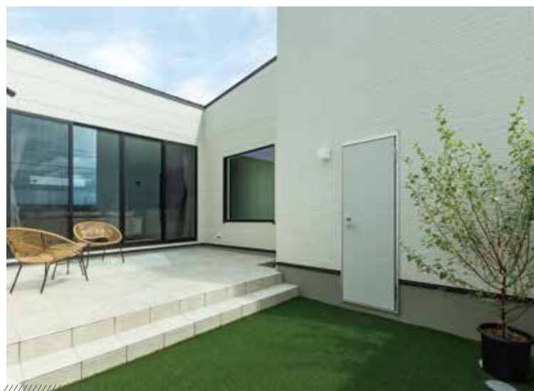
▲三方から囲まれ、プライバシーが保たれたのびのびと過ごせる中庭スペース