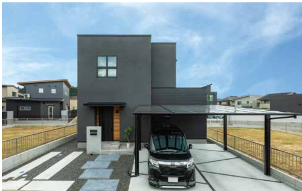
▲ダーク系の配色 × 木目でシックにまとめた異素材を組み合わせた外観デザイン

破損・ひび割れ・欠け・異音・剥がれ・めくれ・沈み・凹みなどがいないかその他、気になる部分があれば何でもメモして、できれば写真を撮っておきましょう。