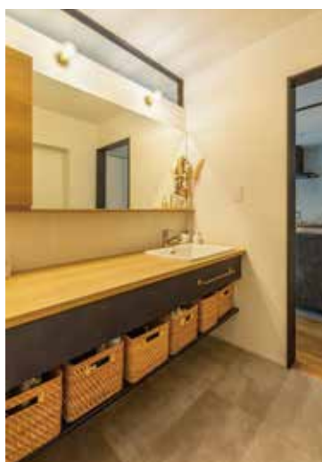
▲天井付の室内窓を付けることで、窓のとれない洗面室にも自然な明かりをとることができます