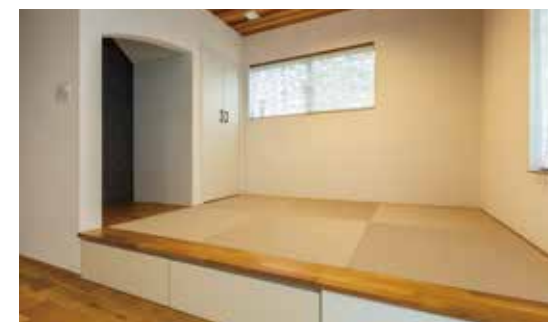
▲お子様の成長に合わせて様々な用途に使える小上がり和室