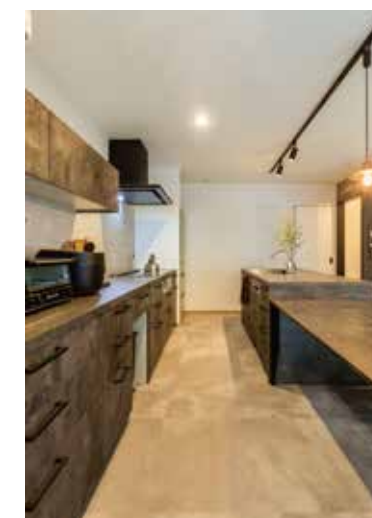
▲セパレートキッチンで作業動線を短く