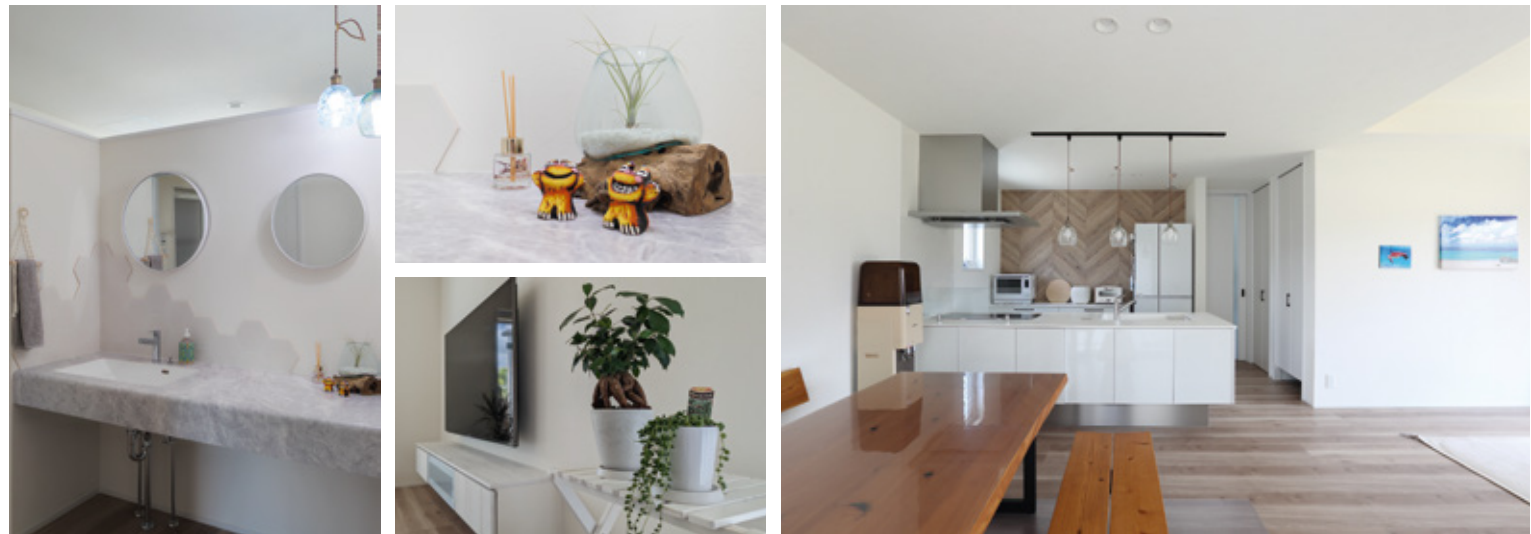
内観は白色を基調とし、南国のテイストを巧みに組み込み、お施主様が選んだ琉球雑貨を際立たせています。