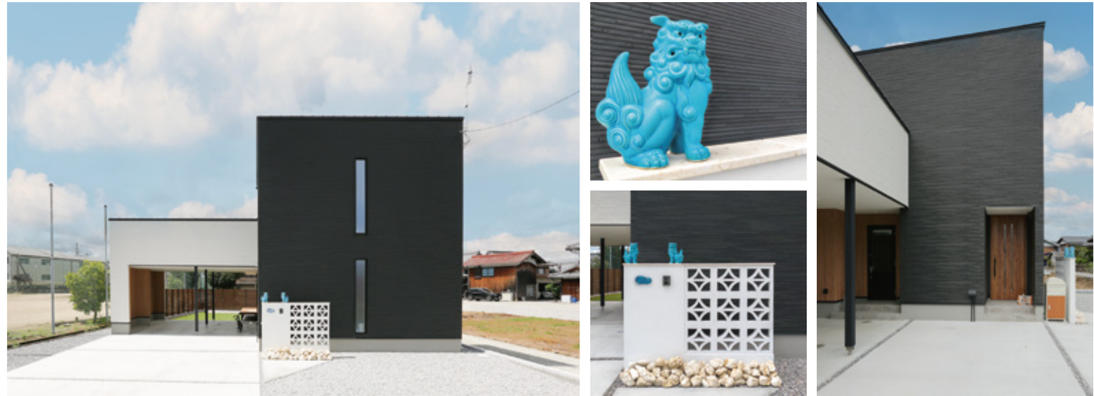
建物の外観はシンプルにデザインされ、門扉には沖縄の伝統的な要素である花ブロックとシーサーを取り入れています。これにより、周辺環境に馴染みつつも、沖縄の文化や風情を感じさせる家となっています。