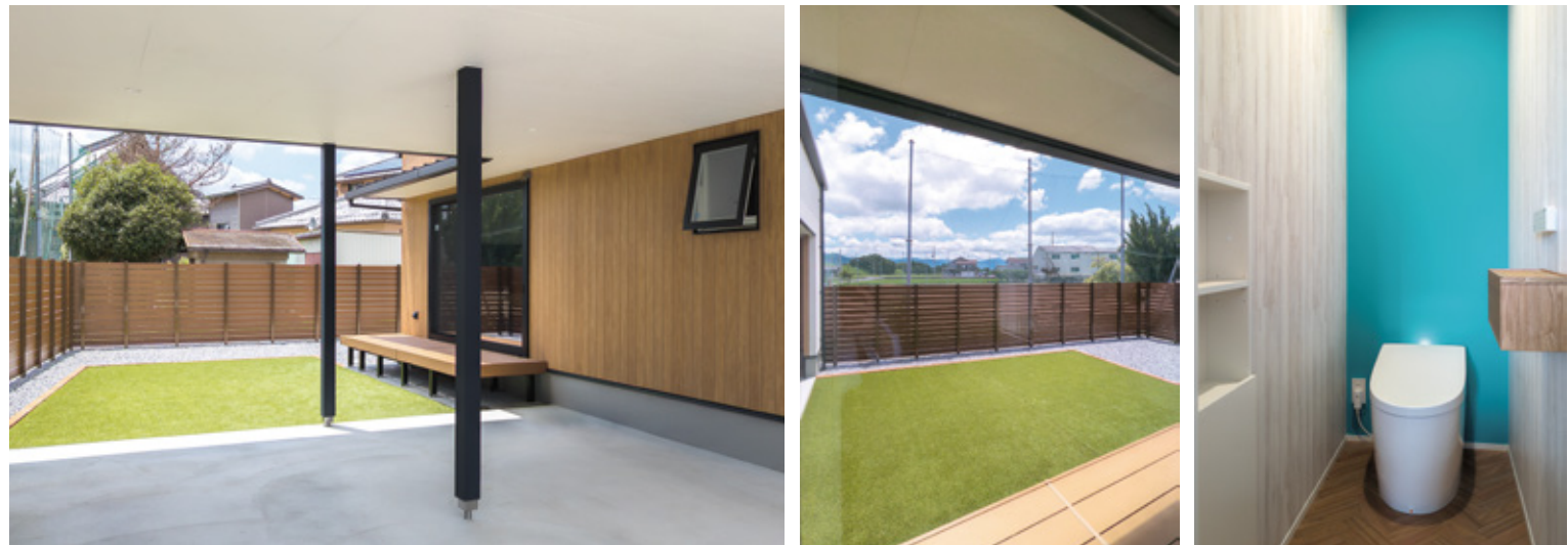
雨の日でも安心のインナーガレージはお子様の遊び場や趣味のスペースとして多彩な使い方ができます。さらに、目隠しフェンスがプライバシーを守りながら、明るく開放的な生活を実現しています。