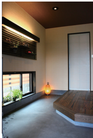
(右)ご主人提案の飾り棚と間接照明が幻想的な雰囲気を醸しだし、訪れる人を温かく迎える玄関ホール。 (左下)お施主様が埋め込まれたガラス石のアクセント。 (左上)照明の光と色合いが美しい、落ち着いた雰囲気のトイレ。