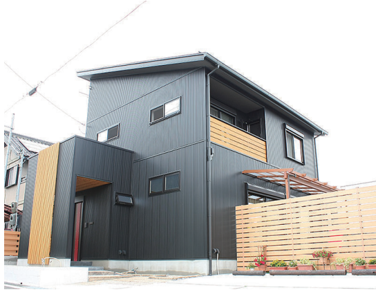
(上)外壁はメンテナンス性を考慮して金属サイディングを採用。ブラックのサッシに赤い玄関扉とレッドシダーの格子がポイントとなり、新しいフォルムの中にも、落ち着いた赴きを感じる仕上がりとなっています。 (左)黒い外壁に映える鮮やかな芝生はご自身で施工されたもの。LDKからつながるウッドデッキは、休日の憩いの場所となりお二人を癒してくれそう。

新しいフォルムの中に おもむきのある外観 当初0様はハウスメーカーや地域の工務店を見て廻り検討されていきました。当社で建築された知人より蒲生工務店のことを聞き色々なこだわりが他店よりも安価で実現出来る場所に惹かれ、当社に決定したと話してくださいました。0様はこだわり部分を随所にお持ちでしたが、ご希望であった落ちついた雰囲気が見事に演出された仕上がりで大変ご満足いただきました。また器用なご主人様は、今も外構などをご自身で進めておられます。これからも0様に愛され共に息づいていく素敵なお家です。