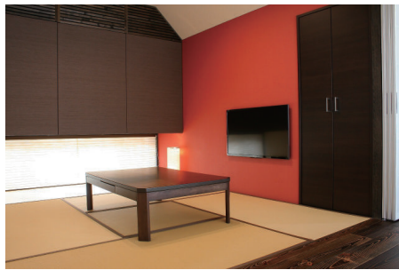
(上)幅広サッシを取り付けたLDKは大変明るく風通しも良い快適な空間。テレビ台の裏に設けた収納スペースは、小物や散らかりがちな物が、サッと片付けられ大変便利です。 (左下)LDKに隣接する和室は吊押し入にして採光・通風も確保。上部の格子は空調を隠して、雰囲気を損なわないよう配慮しています。

木質感の落ち着く雰囲気 やさしく包まれる癒し空間 高くした天井と化粧梁の色合い、フランス産ポルドーパインの無垢床材とのコントラストが抜群の相性。空間をやさしく包み込むような、落ち着いた雰囲気に癒されます。