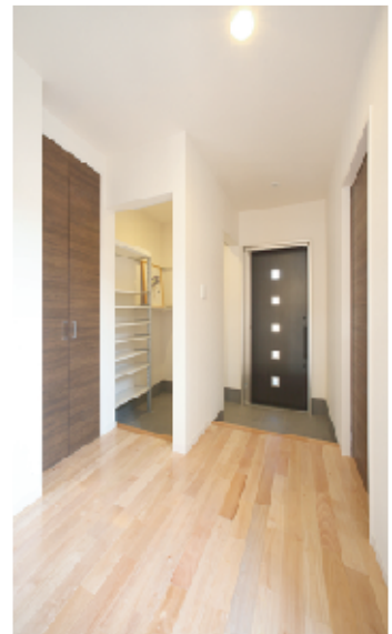
(右・右上) 大容量のエントランスクロークを備えた玄関ホール。 (上左) お施主様ご購入の手洗い鉢を取り付け、小物を収納する棚を取り付けました。 (左) 窓越しに見える中庭の井戸と植栽が風情を醸し出し、ゆったりと落ちついた雰囲気の中庭。