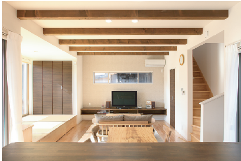
(右) 床は肌触りのよい無垢材を使用し、体にやさしい温水式の床暖房を採用。タタミコーナーにはカウンターを設置。パソコンをしたり宿題をしたり、みんなが使えるスペースです。タタミの下は引出し式の収納棚を設置し、大容量の収納が可能です。

天井を高くし、化粧梁をアクセントにしたリビングは、陽当たり抜群。畳コーナーやウッドデッキともつながる、大変明るく広くくつろぎ空間です。