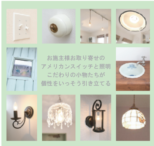
お施主様お取り寄せの アメリカンスイッチと照明 こだわりの小物たちが 個性をいっそう引き立てる