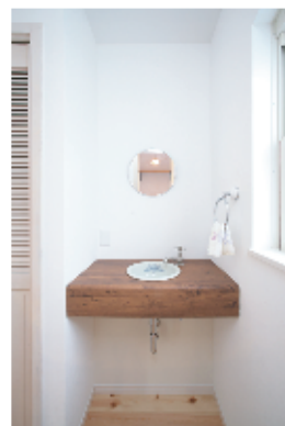
(上) 陶器の手洗器を埋め込んだオリジナルの洗面台は、帰宅時の手洗いとトイレの手洗いを兼ねて使用。トイレの照明はスタンドグラスの可愛い模様入り。 (左下) 将来間仕切る予定の子供室は、ドアの上部にガラスブロックをはめ込んでいます。