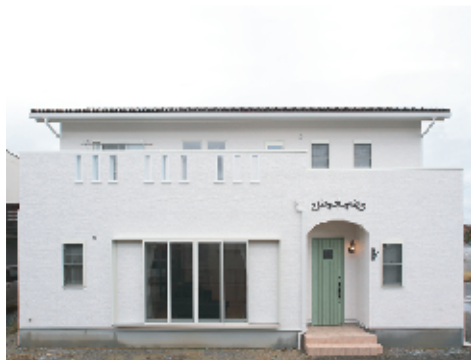
(上) 白亜の殿堂のごとくすっきりと洗礼された白の外観がとてもキュート。外国で見かけた風景を思い出すような新鮮な感覚の外観です。 (左) ワンポイントを添えたグリーンの玄関ドア。お施主様支給のアイアン風妻飾りととの相性が抜群に映えています。