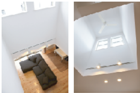
(右) シューズクロックを併設した広がりのある玄関ホール。お洒落なシャンデリアとニッチがアクセントに。(中央) 白を基調としたLDK。ダイニング側の壁にはアクセントにタイルを貼りました。深夜電力を利用して、蓄熱レンガに熱を蓄え、その熱を利用して部屋を暖める蓄熱暖房機を設置しています。(左) 吹き抜けから陽光が降り注ぐリビングは、明るく快適なつろぎ空間です。