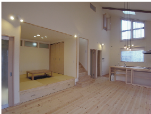
(上) 無垢材や珪藻土など自然素材を採り入れ、梁を天井高まで上げることで実現した、吹抜けの大空間。 (右) キッチンのカウンターと食器収納棚は、収納物に合わせて自社で作製したオリジナルの造作家具。 (左) 暗くなりがちな廊下は、上部に明り窓を取り付けることで、吹抜けから採り込んだやわらかい光が廊下を照らしています。