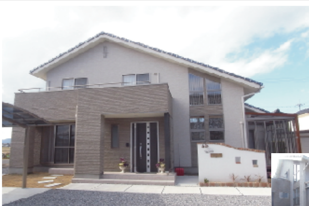
(右) リビングに隣接するサンルームは全開口サッシを採用。お天気の良い日は、開放してテラスでティータイムを。雨の日には閉じると、お洗濯物を干したまま安心して出掛けられます。