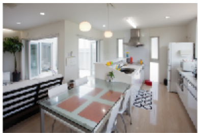
(上) オープンテラスを囲んで配置したLDK。白を基調とした内装は、明るくさわやかな印象。テラスから注ぎ込まれる、やわらかな光と風に抱かれているような、心地いい空間となっています。 (左) I型に配置したキッチンとダイニングは動線がよく、テキパキとお料理や片付けがはかどりそう。掃き出し窓からテラスに出られ、気軽にランチを楽しむこともできる、オープンな感覚のキッチンです。