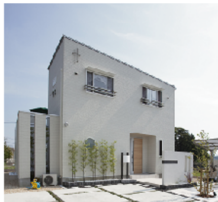
(上) 片流れ屋根のシンプルなフォルムは、植栽をアクセントに加えてさわやかな印象に。 (左) リビング・キッチン・和室のどの部屋からも出入りできるオープンテラス。道路からの視線は縦格子でさりげなく遮った、開放的なプライベート空間です。