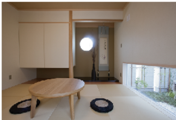
(上) 外観のイメージからは、想像できないような落ち着いた空間がここに存在します。畳に座ると、地窓から坪庭が目線に新鮮に飛び込んで、時空を超えたような感覚さえ覚えるようです。縁のない琉球畳と床の間に設けた丸窓がいつそう「和」の雰囲気を高めています。