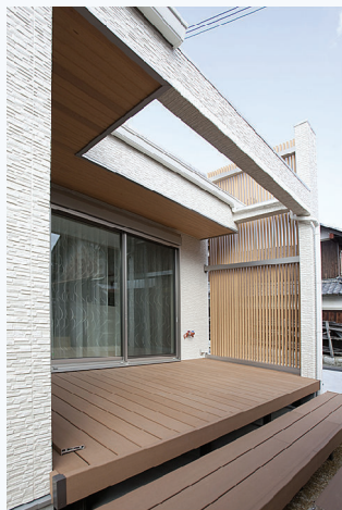
(上)ウッドデッキはLDKのどの部屋からも気軽に出入りができるので、天気の良い日はちょっとコーヒーでも持ち出して、ゆったりとカフェ気分を味わえそうです。