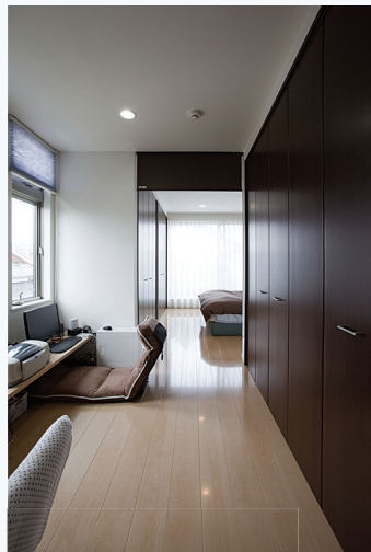
寝室には約4帖の書斎兼クローゼットを併設。ご夫婦でPC作業や読書など、一緒にできる余裕のスペースです。ベッドのカウンターに埋め込まれた間接照明がやわらかな光で寝室を包んでいます。