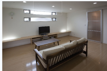
横長の高窓からは、均一な光が部屋の奥まで届きます。