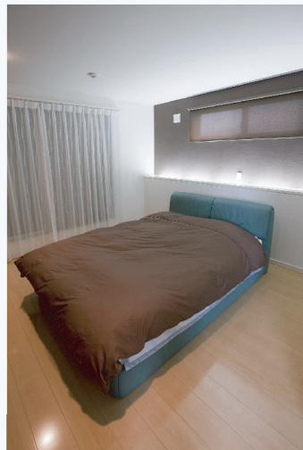
寝室には約4帖の書斎兼クローゼットを併設。ご夫婦でPC作業や読書など、一緒にできる余裕のスペースです。ベッドのカウンターに埋め込まれた間接照明がやわらかな光で寝室を包んでいます。