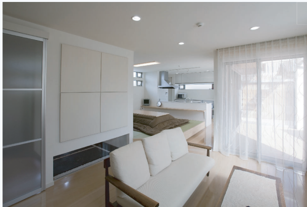
(上)対面キッチンの前のダイニングは姫座卓の畳コーナーに。床高をあげてキッチンで調理している人との視線の差を無くし、対話しやすいようにしました。リビングからキッチンまで見渡せるのびやかな大空間はいつも家族の気配を感じて暮らすことができます。高気密・高断熱を採用しているため、広い空間でも熱効率がよく快適に過ごすごことができます。

当初大手ハウスメーカーでも検討されていたお施主様が、当社を選んでいただいた理由に、構造計算を確実にしていること、間取りの細かな寸法の調整など自由度が高いこと、コストが低く適正であること、を推奨いただきました。