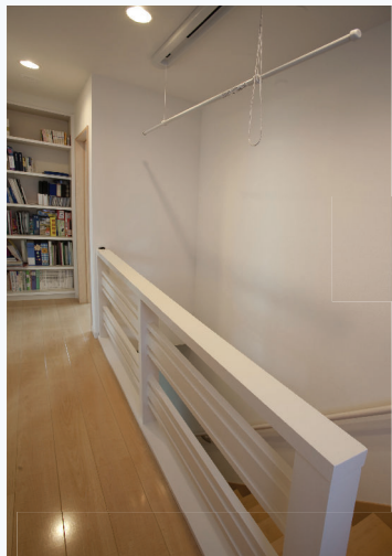
階段への光を遮らないよう、手摺は棧式の手造りに。廊下のデッドスペースを利用して、本棚を設けました。

天気の良い時など、乾かない洗濯物を掛けるのに、人目に付かなくて、邪魔にならない場所を考え、階段ホール上部を物干スペースに利用しました。竿が上下出来るので、干すときはホールから楽に掛けられ、干した後は上にあげておけば、邪魔になる事もなく大変便利です。