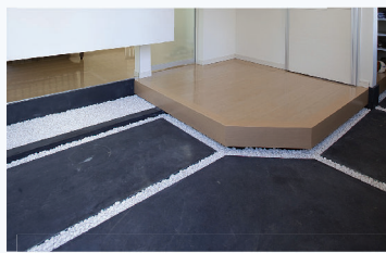
墨モルタル仕上げの玄関土間。目地に玉砂利を敷いてアクセントに。