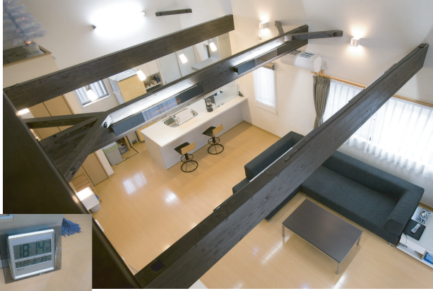
(上) 2階書斎スペースからLDKの眺め。キッチンまで見渡せる。

オール電化の深夜電力なので、24時間フル稼働しても、8,000円/月のランニングコストで快適な暮らしができます。床暖房は昼間と深夜は弱運転、夜間在宅時間のみ強運転で使用。これだけの大空間でも問題なく、床暖房をしていない2階の各部屋までも寒さを感じない程です。