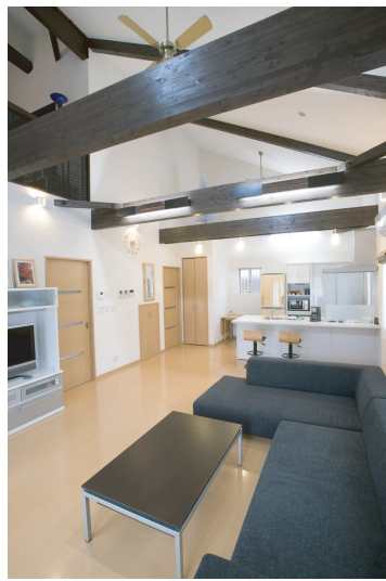
(上) あらわし梁と大屋根の形状を活かした大空間のLDK。