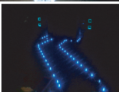
(上) 光に誘われるアプローチ。

通りがかる人々の心をも癒す 幻想的な雰囲気のイルミネーション つい足を止めて見入ってしまう、光の世界に引き込まれそうな、幻想的なイルミネーション。徐々にグレードアップされています。