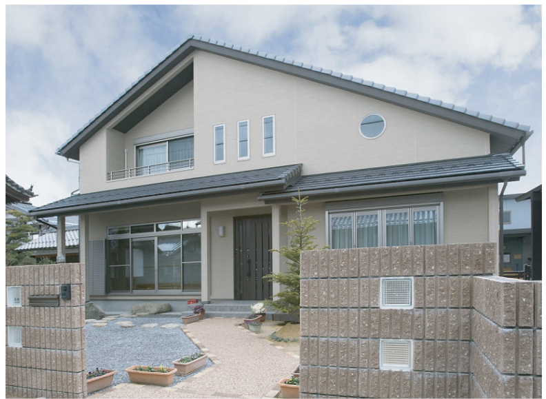
(上) 片流れ屋根と落ち着いた色合いが悠然とした外観のお宅。