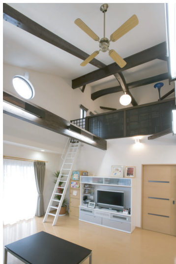
(上) リビングから2階の書斎スペースへと繋がるダイナミックな吹抜けは空間にゆとりを与えています。