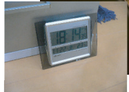
各部屋に温湿度計を設置して管理

かねてより気密断熱に興味を持ち熱心に勉強しておられた施主様は当社の推奨する【次世代省エネ基準】のオール電化住宅をご採用いただき、さらに1階全面に電気温水式の床暖房を敷設されました。次世代省エネ基準とは気密断熱を高める事で極めて少ないエネルギーで家全体を計画的に温度調節し、健康快適で質の高い住空間を造る目的のものです。ご入居一周年を迎えられた施主様に、ご感想をお伺いしたところ、真冬の外気温0度以下の日も床暖房だけで家全体が20度以上に保たれており、しかもコストも少なくストレスのない快適な生活を満喫している...と思った以上の効果に大変満足していると話していただきました。