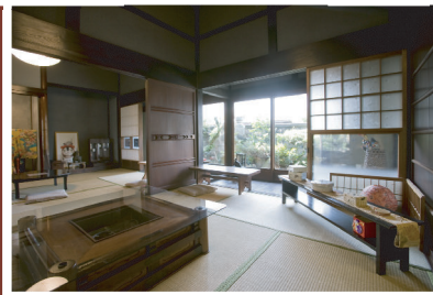
(左) のれんをくぐると土間の玄関。民家和室のカフェはとても落ち着いた癒し空間。

自分の家に居ながら、居間に座っていると、とてもくつろげ癒されます。それは「我が家(店舗)」であるからという事だけではなく、古民家特有のゆったりとした間取りであったり、梁や柱・家具などに蓄積された時の流れが、そうさせるのだと思います。 現代の感覚では、我が家の家屋の高さを考えると、十分に二階建てのボリュームがあるのですが、そこは「茅葺き」で、一階のみのつくり、結果その天井の高いこと。又、天井一面に貼られた煤竹の渋さ。限られた空間の中で「効率」をとことん追求する現代の家屋とは、「生活」に対する考え方が基本的に違うのでしょね。 店舗作りの際には、この「癒しの空間」を最大限残しながら、そこに少しずつ現代的なデザインを取り込んでいくよう留意しました。