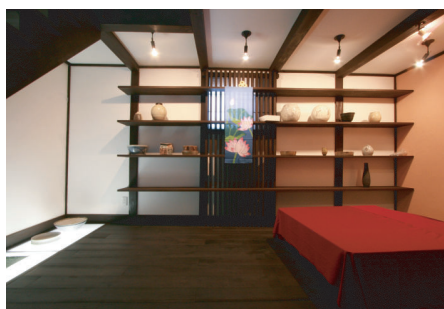
(上・左) 幻想的な雰囲気をかもし出している『蔵ギャラリー』の内部