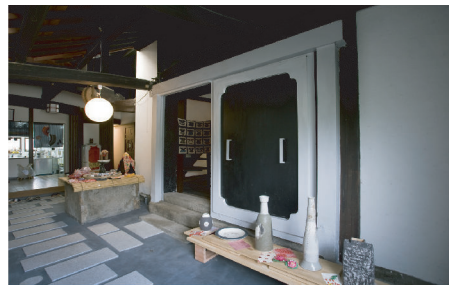
(上・左) 左墨モルタルと敷石で仕上げた通路。古民家の梁の高さと奥行きがゆとりを生む空間となっています。左奥は蔵ギャラリー。

土間通路を奥へ進むと左にある蔵ギャラリーには陶芸作家をしておられるご子息の作品が展示されています。 どれも作り手の指先の温もりが伝わってくるような味わい深い作品ばかり。蔵の漆喰壁・天然木の床材・間接照明が作品をふんわり包み込んでいるような、趣のある蔵ギャラリーです。