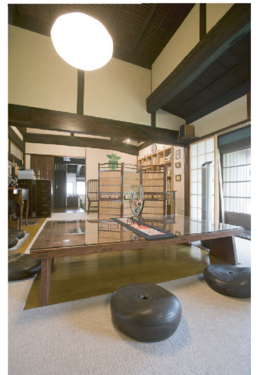
(上) 蔵の戸をリメイクしたテーブル。桐の天然木で手造りした座椅子は座り心地抜群。