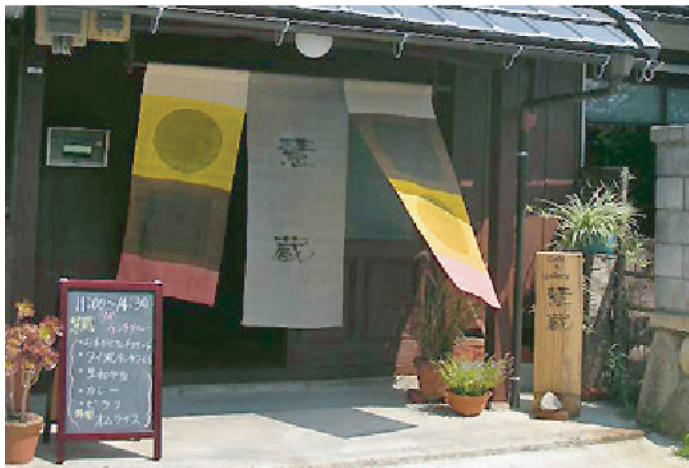
(上) 地元永源寺の染織家作のれんと、アフリカ原産のゼブラウツドで造ったサインが、静かな町並みの中で目印となって出迎えています。

蔵を再生したギャラリーと民家母屋を再生したカフェでは、陶芸作品の展示と地元永源寺の食材を採り入れた美味しいお料理をご提供しています。気さくで穏やかなご夫妻がお出迎えしてくるので、是非一度足を運んでみてください。