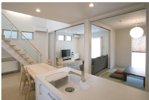
(上)キッチンからの眺め。前にある和室は来客用として、またお子様のお昼寝場所として、色々な使い方が出来ます。