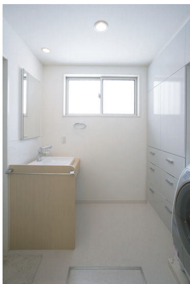
(上)清潔感溢れる洗面脱衣室。