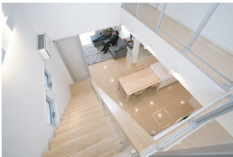
(上)メイプル色でまとめられた暖かさを感じるLDK。

家造りをご検討されていたお施主様は陽当りや風通しはもとより、ご友人を招いての食事会、家族団欒のリビングタイム、子育ての時間等、様々なシーンを想定されていました。そこで間仕切り建具を3箇所配置し、開放時は広々とした大空間に、必要に応じて仕切れば個室として使える可変的な間取りを提案させて頂きました。またご希望のひとつであった吹抜けは北東側に配置することで、隣家が迫っている東側からも朝は清々しい陽光が、日中は安定した明かりが家の中央にあるキッチンまで届きます。