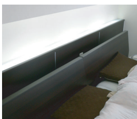
(上)和室の床スペース。