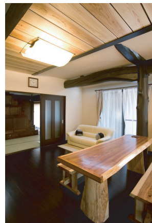
(上)天井板は以前に使われていたものを削って再利用。白木のまま使うことで家具との調和もとれ暖かみのあるアクセントになっています。