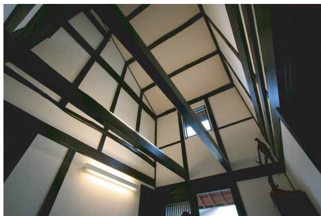
(右)玄関に入るとまず目に飛び込むササラ戸は以前から使用されていたものにガラスを嵌め込みました。吹抜けから注ぐたっぷりの陽光をリビングに届けてくれます。