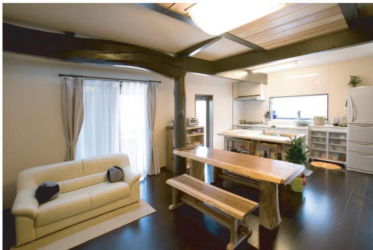
(上)開放的なアイランド型キッチンのあるLDK。ダイニングのベンチは当社大工の手作りです。