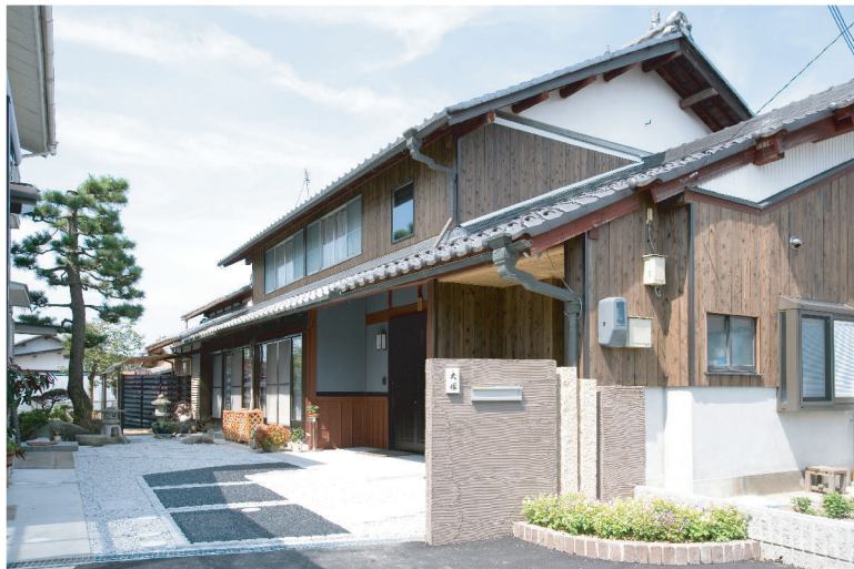
(上)外観を改修してより一層日本家屋の美しさと重厚感がました外観。

そこで施主様より頂いた「和風で落ち着いたある機能的な空間にリフォームしたい」というテーマをもとに、この立派な構造材を前面に出し古民家風に仕上げられることを提案しました。また再利用できるものは、積極的に利用することで新調品では出せない年月が刻んだ美しさを出す事が出来ました。施主様にもこの新しく懐かしい空間を大変気に入って頂いております。