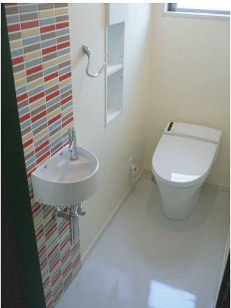
(右) トイレの手洗器前に使用したタイル。鮮やかな赤と淡いその他の色が程よくつりあっています。 (中央) キッチンには透明感のあるガラスモザイクを使用。ダイニングの壁とも良く合っています。 (左) オリジナル洗面台の前には調湿効果がある”エコカラット”のモザイクタイルを貼りました。横には洗濯機側からも取り出せる収納を製作。細かな物も色々収納して頂けます。