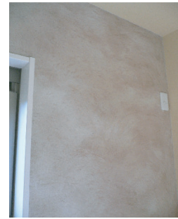
(右上) 構造上抜けない柱を利用した目隠し壁を格子状にしました。 (左上) コテ柄の2色で仕上げられたダイニングの壁