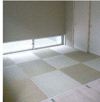
(上) リビングとつながる和室。地窓が”和”の雰囲気漂わせてくれています。道路からの視線も遮ります。