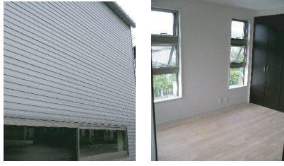
(右上) 外観、内観とも個性的なアクセントになる連装窓。 (左上) ガルバニウムの外壁。断熱材のサンドイッチされた商品で断熱性能もバツグン。耐久性にも優れています。