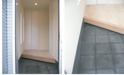
(上) 墨を入れたモルタルで仕上げられた玄関の床。