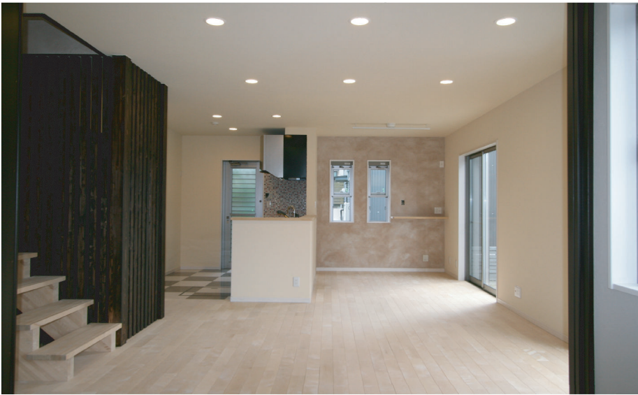
(上) 桜のフローアーに、天井・壁は塗り壁で仕上げたLDK。桜の優しい木目と、白い塗り壁が明るく、ハイセンスな空間を演出しています。台所の床には耐水性・清掃性の高いビニールタイルを貼っています。

クールな外観、スタイリッシュな内観は施主様との共同作業で実現。ツートンに張り分けされたガルバリウム鋼板の外壁は建物をシンプル&クールに飾っています。内観は色々な素材と色彩でコーディネート。奥様のこだわりと幅広いセンスから生まれました。また型枠大工をされているご主人様とご友人の土建屋さんが共同で基礎を、お知り合いの塗装屋さんが内装の仕上げを施工。施主様との共同作業で世界でひとつだけの素晴らしいお宅に仕上がりました。